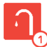
TABLA DE ESPECIFICACIONES